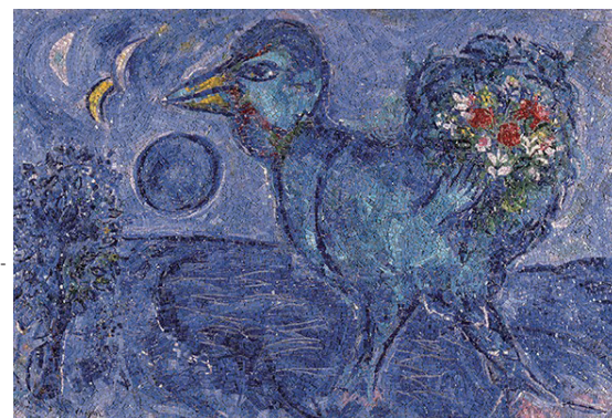
Marc Chagall, Le Coq bleu , 1955- 59, mosaico realiz- zato da Antonio Rocchi, Ravenna, MAR - Museo d'Arte della città di Ravenna © Chagall ®, by SIAE 2025

Bright colours, daydreams, figures that seem to float in the air: Marc Chagall's poetic imagery is known throughout the world, but few people know that, between the 1950s and 1980s, the artist devoted himself intensely to the art of mosaic, leaving a profound and still surprisingly little-known mark.