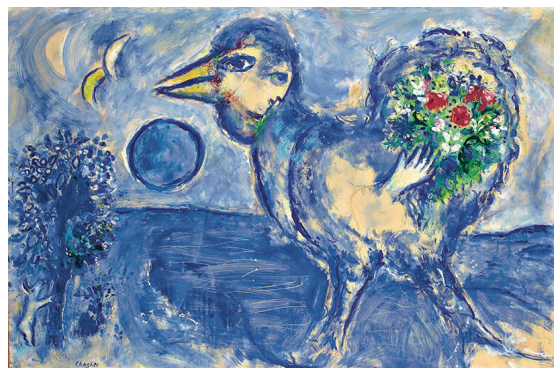
Marc Chagall, bozzetto per il mosaico Le Coq bleu, 1955, gouache, acquarello, matita su carta applicata su tela, Paris, Collection Berulle Art