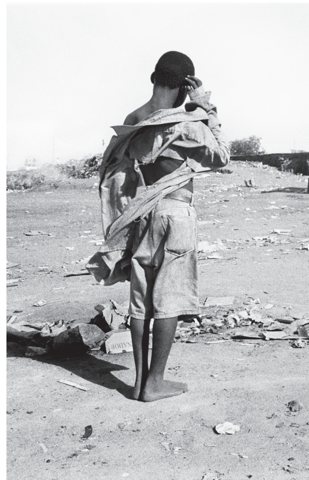
Child in Santeiro, Brazil, 1999, Roque Santeiro

La linea sottile tra realtà e rappresentazione scenica , documentario e arte, comportamento umano e recitazione è l'esatto attrito che lo affascina e lo porta a tornare nelle strade e nei luoghi in cui la condizione umana viene messa in discussione.