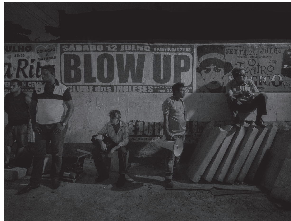
Scene# 3959, Brazi, 2014

The Andante exhibition is presented by the Culture Department of the Municipality of Ravenna and by MAR.