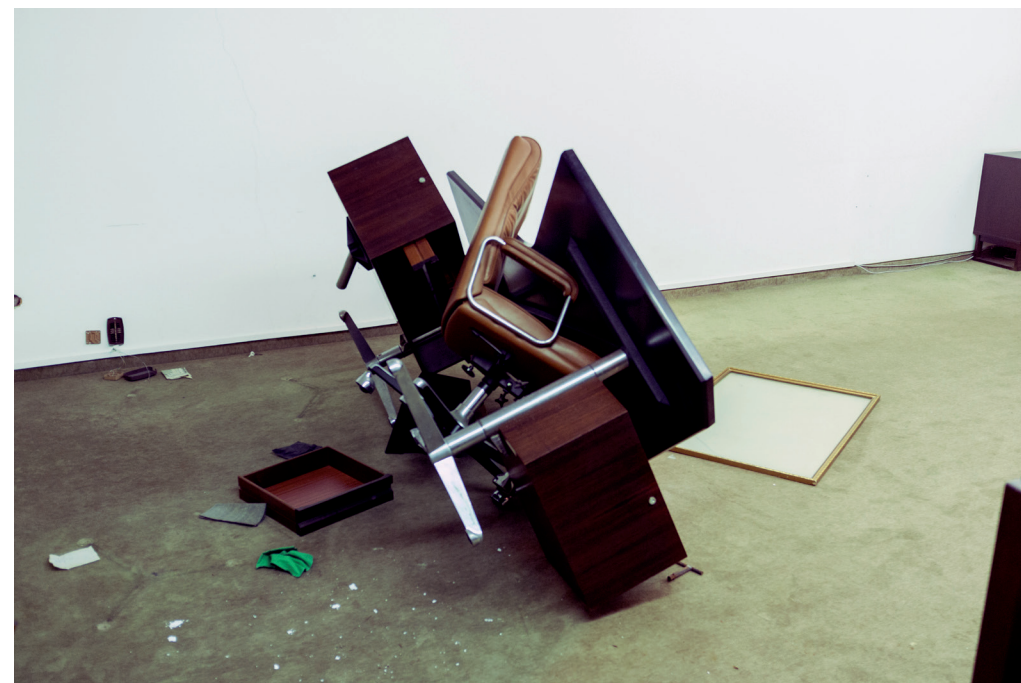
Gheddaffi's desk, LIBYA 2011, Tripoli, inside the head quarter of the ex security service, "estikhparat", after they were looted

La mostra Andante è presentata dall'Assessorato alla Cultura del Comune di Ravenna e dal MAR-Museo d'Arte della città di Ravenna.